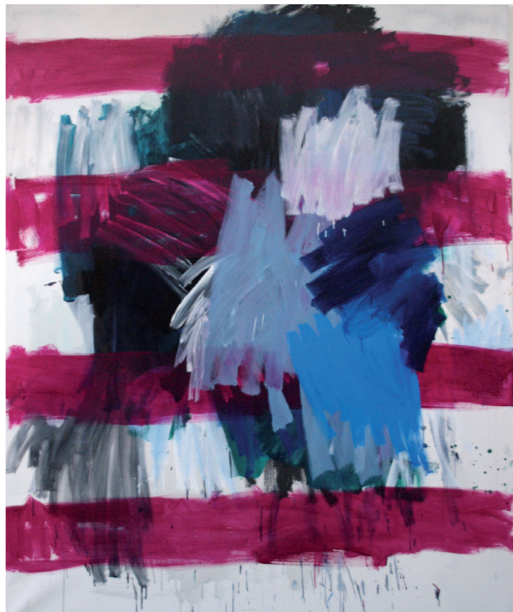
"The bride ship" Técnica: mixta sobre lienzo Año: 2012 medidas: 195 x 162