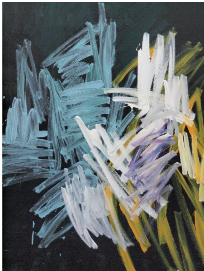
"The adversary" Técnica: mixta sobre lienzo Año: 2012 medidas: 195 x 162